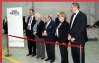
Завод по покрытию медных плит кристаллизаторов «МНЛЗ», г. Челябинск