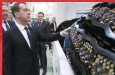
АО «Транснефть Нефтяные Насосы»