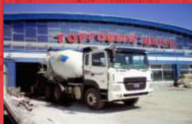
Челябинский «Торговый центр». Реконструкция цокольного этажа