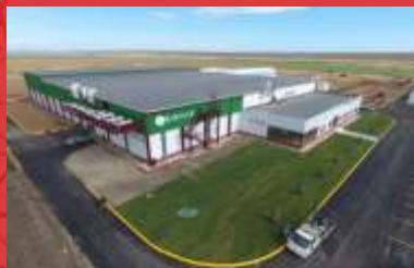
Виноградный питомник «Южная». Краснодарский край, пос. Таманский