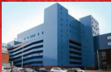
Многоуровневая парковка бизнес-центр «Челябинск Сити» г.Челябинск