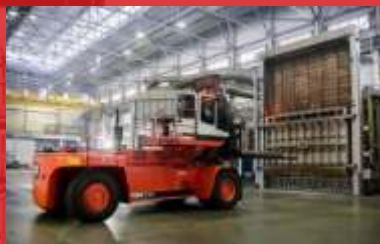
Завод «Трубодеталь» г.Челябинск