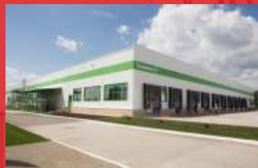
Производственный корпус МПК «Ариант», рзд. Серозак