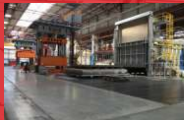
Реконструкция трубосварочного цеха №8 ОАО «ЧТПЗ», г. Челябинск