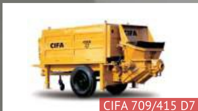
CIFA 709/415 D7