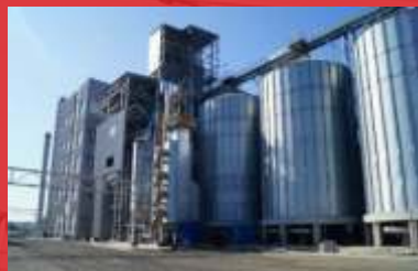
Комплекс зданий и сооружений ОАО «Макфа» Алтайский край, с.Троицкое